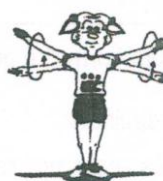
Círculos de braços