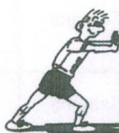
Alongamento do gêmeo