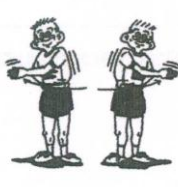
Rotação do tronco