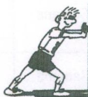
Alongamento do gêmeo