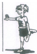
Alongamento da coxa