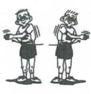
Rotação do tronco