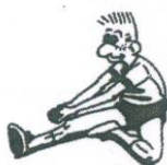
Alongamento da coxa sentado