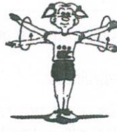
Círculos de braços